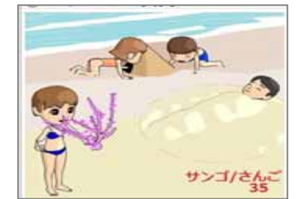
35.パラメーター サンゴ砂は元は珊瑚