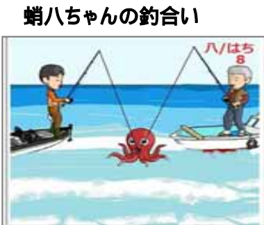
蛸八ちゃんの釣り合い