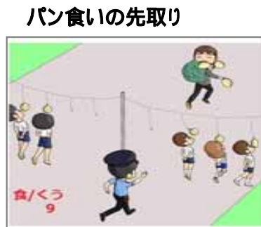
パン食いの先取り