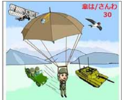
30.薄膜利用 落下傘は幕利用