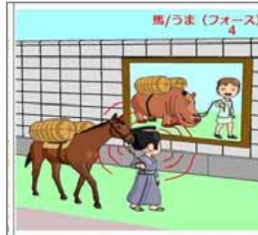
4.非対称 馬の鏡非対称