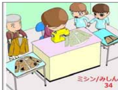
34.排除 / 再生 ミシンで古着を再生