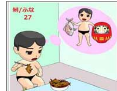
27.高価な長寿命より安価な短寿命 撮影練習は鮎、本番は鯛