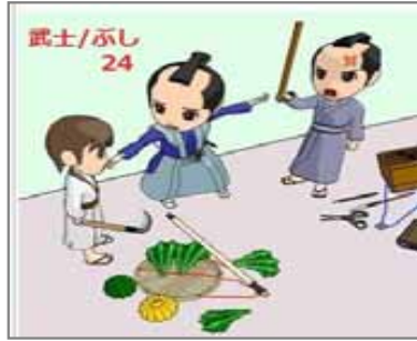
24.仲介 武士のケンカの仲介