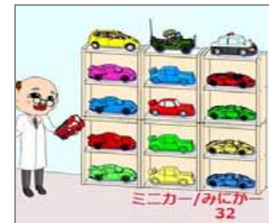
32.変色 ミニカーは色とりどり