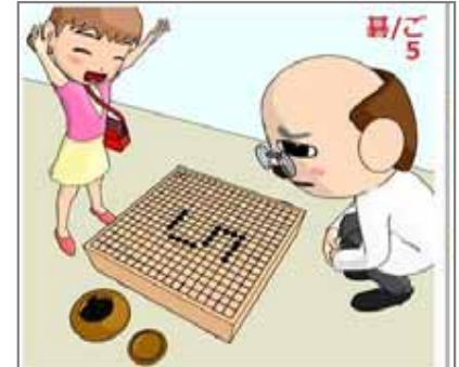
5.組合せ 碁は組合せ