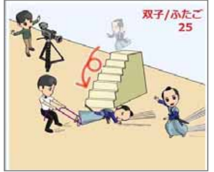
25.代替 双子による代理役者