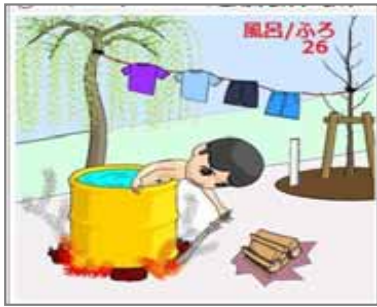
26.セルフサービス 風呂炊きはセルフサービス