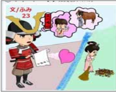
23.フィードバック 文は心をフィードバック