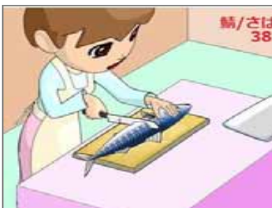
38.高濃度酸素利用 鯖は酸化しやすい