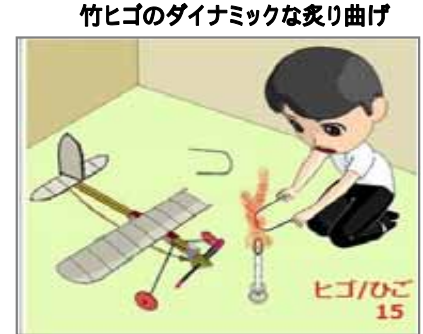
竹ヒゴのダイナミックな炙り曲げ