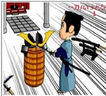
1.分割 一刀分割 試し切り