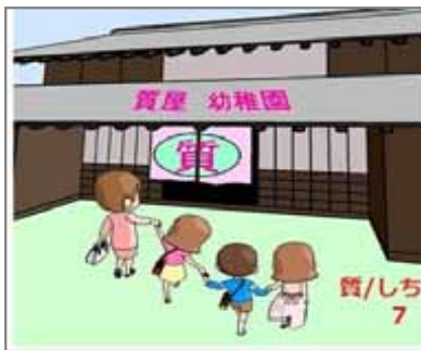
7.入れ子 質に入れ子ダメ