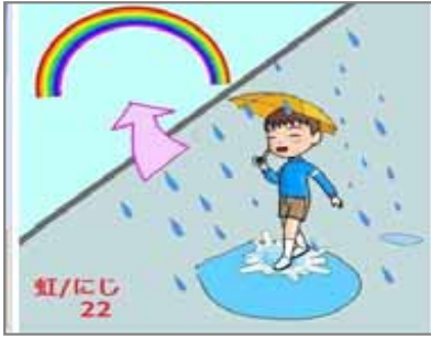
22.災い転じて福となす 土砂降り後の虹