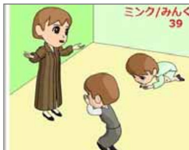
39.不活性雰囲気利用 ミンクのコートは貸せない