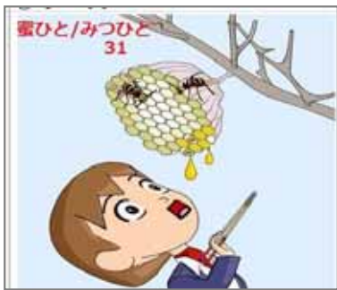
31.多孔質 蜜ひとと蜂巣から