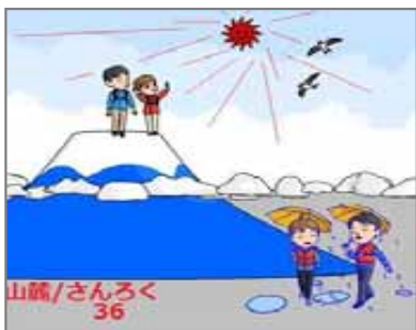
36.相変化 山麓の気候変化は早い