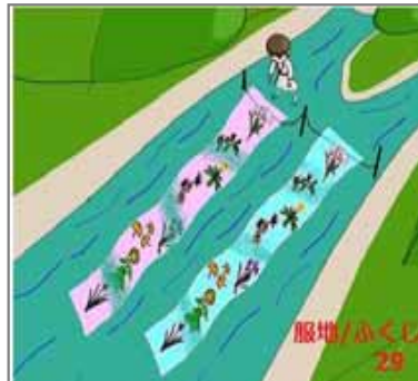
29.流体利用 服地洗いの水流し