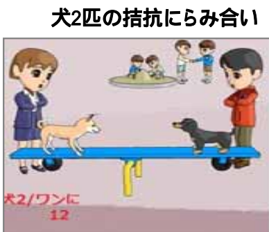
犬2匹の拮抗にらみ合い