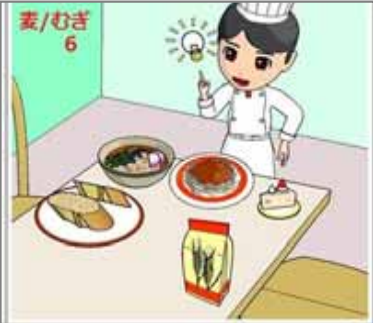
6.汎用性 麦は汎用材