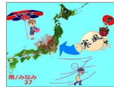
37.熱膨張 南風フェーン現象で熱膨張