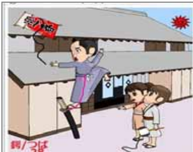
28.機械的システム代替 錨はハシゴの代替