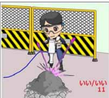
11.事前保護 いい保護眼鏡